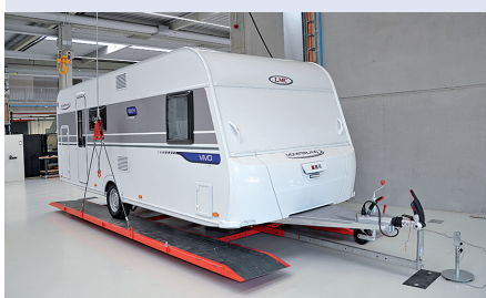
SROVNÁNÍ S OSTATNÍMI TESTOVANÝMI KARAVANY

Dobře vyvážené zatížení kol, ale v prázdném stavu ukazuje váha u LMC Vivo enormně vysoké svislé zatížení těžného zařízení. To vyžaduje dobré a promyšlené rozložení nákladu, jinak bude těžné zařízení přetíženo. Hodnoty naměřené na zkušebním stavu jsou průměrné, zatížení je na dobré úrovni.