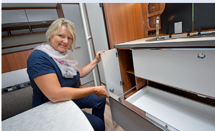
SROVNÁNÍ S OSTATNÍMI TESTOVANÝMI KARAVANY

U rodinného karavanu je důležitým parametrem pro pohodlný pobyt velký úložný prostor. Po zhodnocení velké šatní skříňe, další skříňe na prádlo v dětské části, průběžných skříňek u stropu a velkého kuchyňského bloku dochází odbornice k závěru – tento karavan uspokojí každou rodinu.