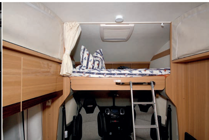
↑ Spání v alkovně je pro dva dospělé dostatečně komfortní, praktické jsou úložné prostory na drobnosti i čtecí lampička.