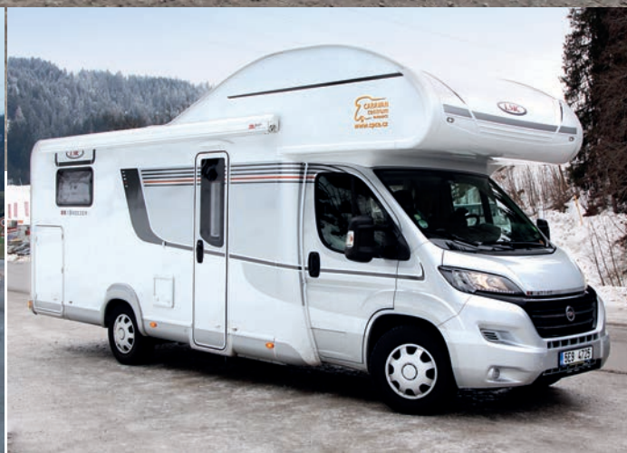
↑ Po dálnicích jsme jeli maximálně 110 km/h, přesto se průměrná spotřeba vyšplhala na 13 litrů na 100 km.