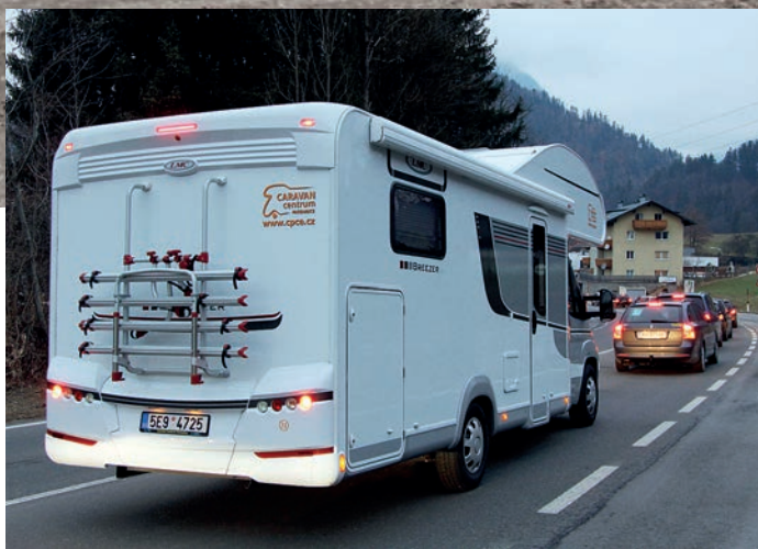
↑ Vraceli jsme se v neděli, a tak nás neminula zácpa před hranicemi s Německem...