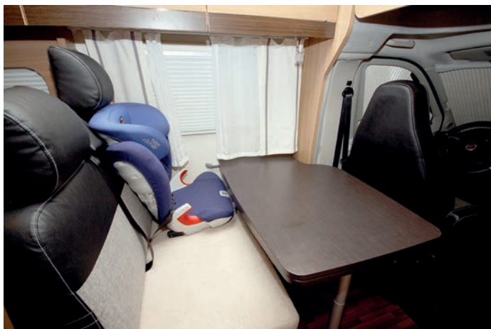
↑ Na sedačce u stolu se za jízdy sedí pohodlně, přestože je jedním z pasažérů dítě v sedačce.